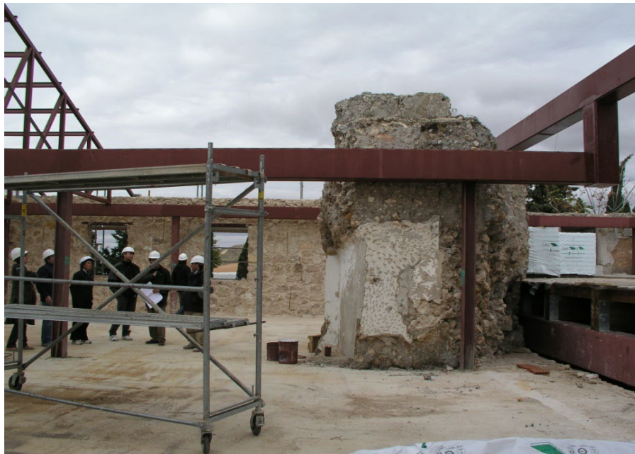
Parte superior de un torreón del Castillo del Infante Don Juan Manuel (Belmonte, Cuenca), reutilizado como Convento de Santa Catalina de Siena, durante su integración en la 1ª planta de un nuevo hotel.

También debes tener en cuenta que un castillo, una catedral, una iglesia, una ermita, un palacio, una casa, un molino, una fragua..., cualquier tipo de construcción, pueden ser estudiados con metodología arqueológica –la arqueología de la arquitectura–, y son considerados, por tanto, yacimientos arqueológicos.