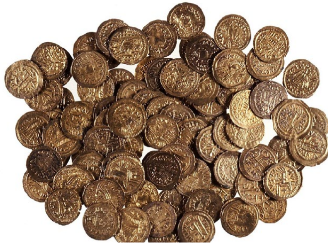
Tesoro de Recopolis (Guadalajara), formado por trientes visigodos ocultados entre los años 576-578/79.

Las ocultaciones intencionadas de conjuntos de monedas se denominan “tesoros” o “tesorillos”.