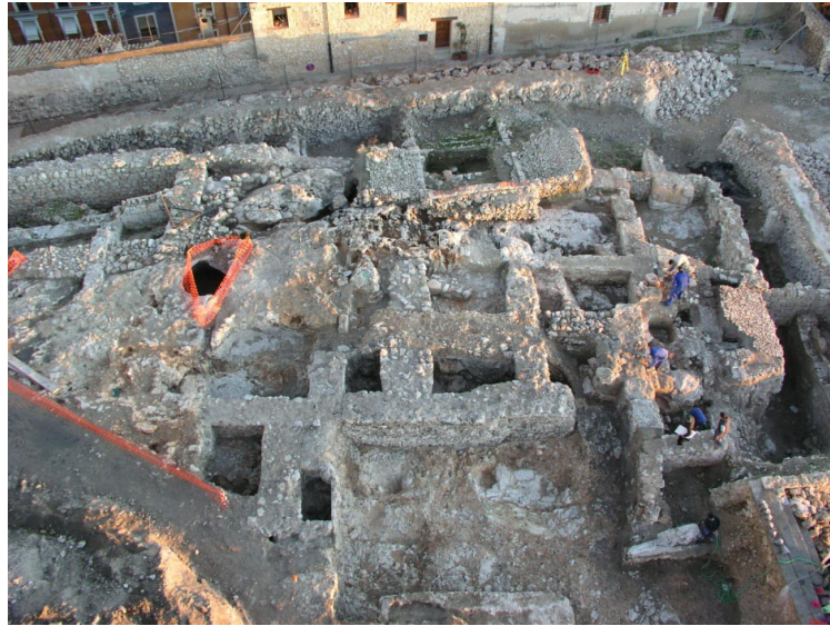
Excavación arqueológica realizada en la Plaza de Mangana, de la ciudad de Cuenca, con restos andalusíes (alcazaba), judíos (sinagoga y viviendas) y cristianos (iglesia y viviendas) hasta el s. XIX.