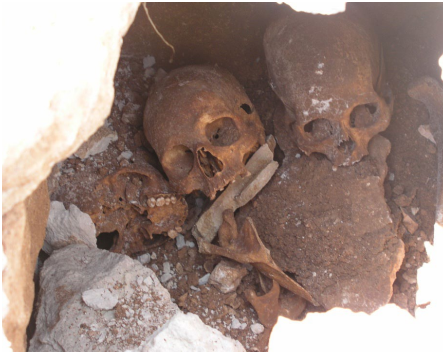
Descubrimiento de una tumba de la necrópolis visigoda de Los Colmenares (Almodóvar del Pinar, Cuenca).

Cuando los elementos arqueológicos permanecen “in situ” tal cual cesó la actividad humana se denominan contextos primarios, o en posición primaria. Cuando esos elementos han sido desplazados o movidos, ya sea de forma natural o antrópica, se denominan contextos secundarios o en posición secundaria. Un ejemplo de yacimiento arqueológico en posición primaria es el de Ambrona (Soria), un cazadero del Paleolítico Inferior , que actualmente puede ser visitado in situ; un ejemplo de yacimiento arqueológico en posición secundaria es el yacimiento de Pinedo, junto a la ciudad de Toledo, se trata de un lugar donde fueron acumulados muchos útiles líticos del Paleolítico Inferior, por arrastre de las aguas del río Tajo.