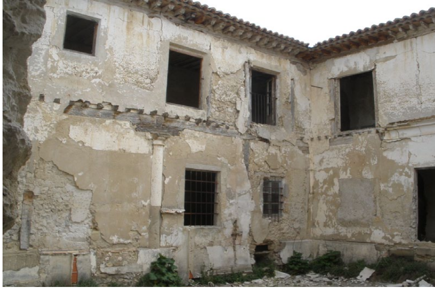
Colegio de los Jesuitas (Huete, Cuenca)

Un caso particular de yacimiento arqueológico es de los pecios o barcos hundidos, estos también sufren alteraciones después de su hundimiento en el fondo marino. Influyen el propio choque con ese fondo, según sea más arenoso, rocoso..., los microorganismos perforadores que atacan los elementos orgánicos del barco y su carga, como el molusco bivalvo teredo navalis , que actúa a una profundidad de 200 metros. Si el fondo marino es arenoso las corrientes de agua harán que los restos queden cubiertos y, a su vez, protegidos por ese sedimento, como ocurrió con el pecio holandés Avondster, hundido en 1659 en las costas de Sri Lanka, durante el tsunami de 2004.