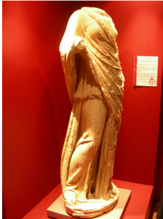
Escultura romana esculpida por Zenón de Afrodiasias (Turquia), encontrada en las excavaciones arqueológicas del jardín del Palacio Ducal de Cogolludo (Guadalajara), a donde fue llevada en el s. XVI.